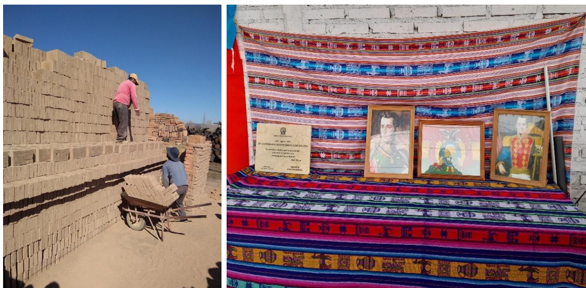
Figura 3. Hornos de ladrillo en distrito “Las Malvinas”. Ornamentación Acto Día de la Independencia de Bolivia (agosto 2022)

entre otras dependencias locales. De entre todas estas actividades hemos presenciado a través de la técnica de observación, los Actos conmemorativos al día de la Independencia de Bolivia —organizados entre el APE y la comunidad boliviana los días 6 de agosto de cada año— así como también distintas ferias gastronómicas y reparto de suministros (semillas, útiles escolares, ropa, calzado, etcétera), por parte de personal del Área. En cada una de esas instancias realizamos notas de campo y entrevistas a diferentes actores presentes en las mismas.